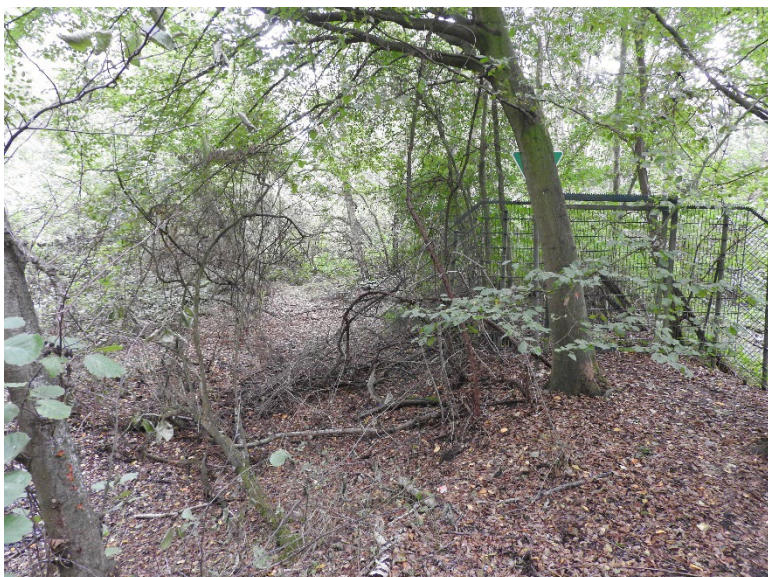
Trampelpfad neben Zugangspforte